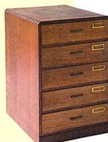
小物や書類入れにピッタリな昭和30年代の植材時代小引き出し箱。W28×D31×H38cm。7,500円。A