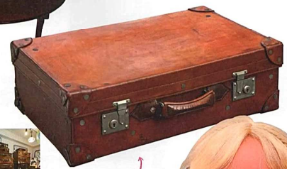
トランクケースは、大きなものはローテーブルとして使ってもおもしろい。写真は明治期の品でW68×D42×H21cm。32,400円