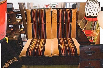
レトロなストライプ柄のソファ。モケット素材のソファは状態のよいものが少ないので貴重。2脚セットで19,800円。C