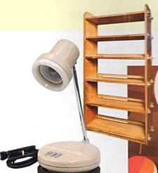
結無垢材の丈夫でシンプルなおしゃれなシェルフ。明治時代に作られたもの。W87×D30×H152cm。27,000円。B