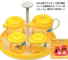
まるみ屋プラスチック製の懸掛トレイと取っ手入れ「1かこ」並上セット。箱付き7,800円。C