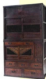
大正期に作られた前タチキ二層木製時代水鏡置(保飾箱)。W69×D46×H151cm。65,800円。A