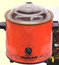
今高品質の電気式保温鍋「クックポット」。内部は陶製製。実用品の箱付きで4,500円。C