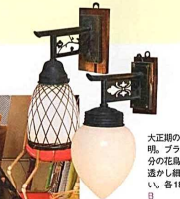
大正期の懸掛け照明。プラケット部分の花鳥や文様の透かし加工が美しい。各18,000円。B