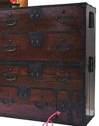
明治時代後期の時代家具。右下には鍵付きの差し出しあり。175,800円。W100×D45×H123cm。A